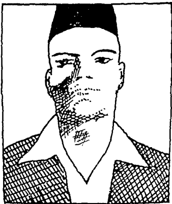
राजगुरु कामी . 23 मार्च, 1931